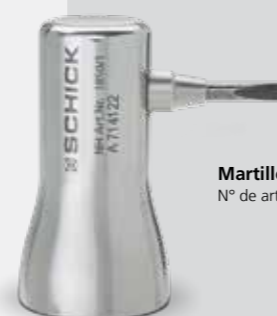
Martillo con el cincel Nº de art. 1850/1*