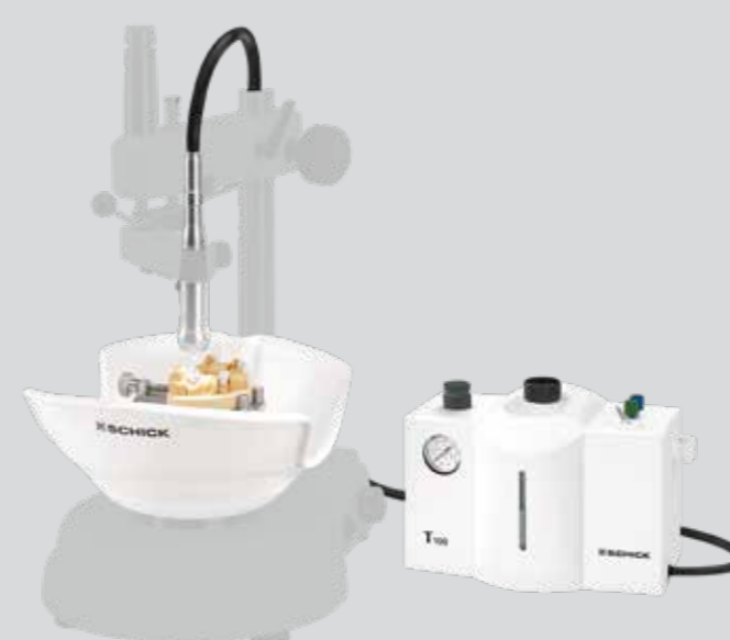
Juego para el fresado de cerámica para S2 y S3 Nº de art. 2650/05

Volumen de entrega: Recipiente de aspiración, separador, turbina T100, mesa de modelo de acero inoxidable, cabeza de luz para turbina, alimentación eléctrica para la cabeza de luz, set de instrumentos de diamante turbina 1,6 mm (8 unidades), set de pulido 2,35 mm (3 unidades), adaptador para turbina