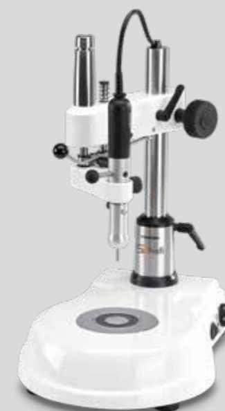
S2 Profi fresadora completa N° de art. 2950 Volumen de entrega: S2 Profi fresadora S2 Profi husillo de fresado con cabeza de luz mesa de modelo no incluido en el volumen de entrega