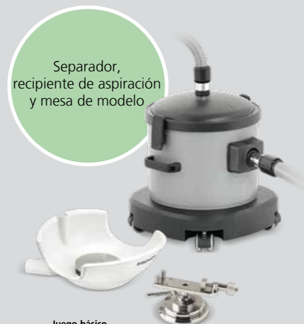
Separador, recipiente de aspiración y mesa de modelo