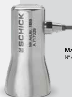
Martillo Nº de art. 1850*