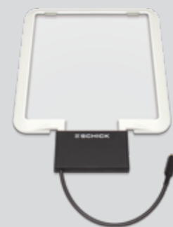
L Protect completo Nº de art. 4460

Volumen de entrega: Placa protectora, Marco de iluminación, Abrazadera