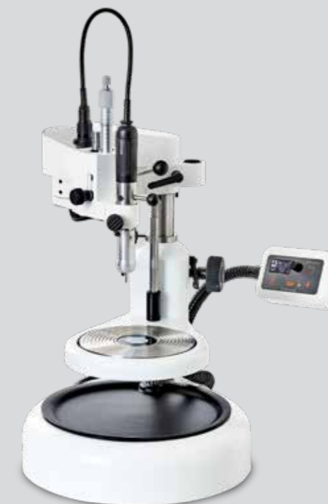
S3 Premium fresadora completa N° de art. 12500 Volumen de entrega: S3 Premium fresadora S3 Premium husillo de fresado con cabeza de luz Pedal para fijación magnética Pedal motor on/off Mesa de modelo y apoyabrazos no incluido en el volumen de entrega