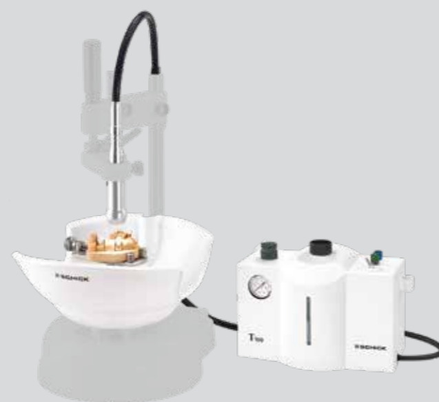
Juego para el fresado de cerámica para S1 y dispositivos de otros fabricantes Nº de art. 2650/15

Volumen de entrega: Recipiente de aspiración, separador, turbina T100, mesa de modelo de acero inoxidable, cabeza de luz para turbina, alimentación eléctrica para la cabeza de luz, set de instrumentos de diamante turbina 1,6 mm (8 unidades), set de pulido 2,35 mm (3 unidades), adaptador para turbina