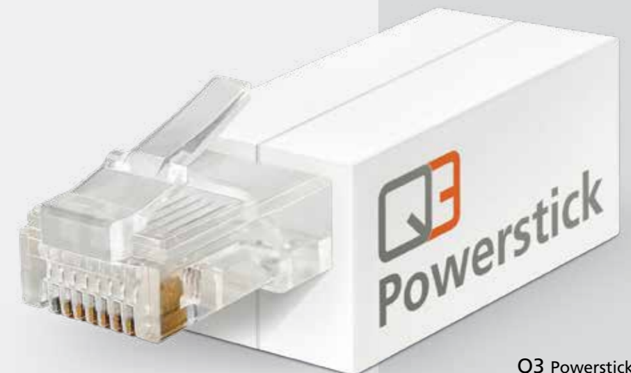
Q3 Powerstick Nº de art. 10745