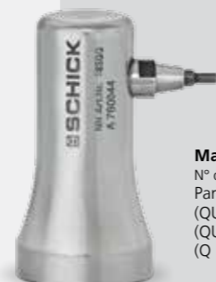
Martillo QUBE Nº de art. 1850/2 Para pieza de mano núm. 9001 (QUBE), 9003 (QUBE Assist), 9500 (QUBE II), 10720 (Q Premium), 9705 (Q Mobile)