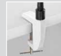
L Protect SH-D con pinza para la mesa Nº de art. 4479

Volumen de entrega: Placa protectora, Marco de iluminación, Brazo regulable, Abrazadera para la mesa