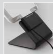
Soporte para mesa (sin L Protect) Nº de art. 4474

Volumen de entrega: Placa protectora, Marco de iluminación, Abrazadera