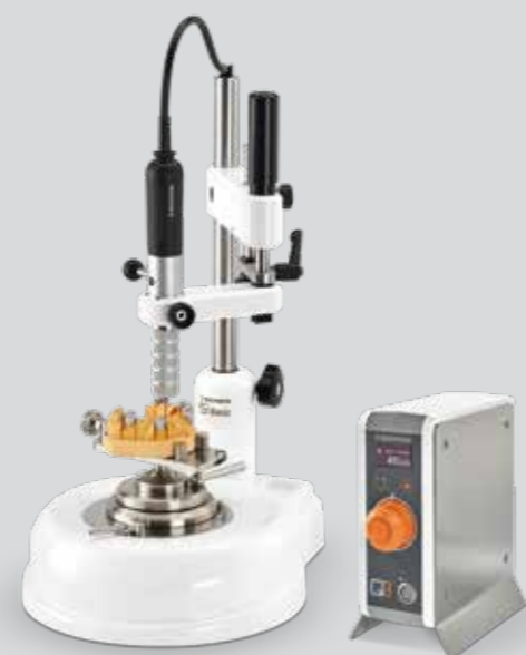
S1 Basic fresadora completa N° de art. 2800/1 Volumen de entrega: S1 Basic unidad base S1 Basic husillo de fresado Q Basic módulo de mando Mesa de modelo