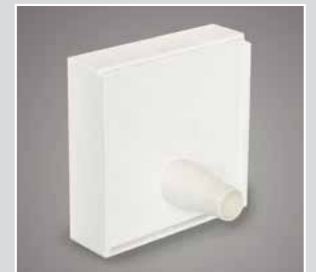
Parte posterior del equipo con placa de conexión de uso opcional para aspiración externa