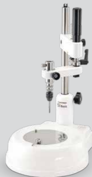
S1 Basic Paralelómetro N° de art. 2810 Volumen de entrega: S1 Basic unidad base Husillo de medir Portaminas