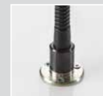
L Protect SH-DTF con pie de sobremesa Nº de art. 4479/1

Volumen de entrega: Placa protectora, Marco de iluminación, Brazo regulable, Abrazadera para la mesa