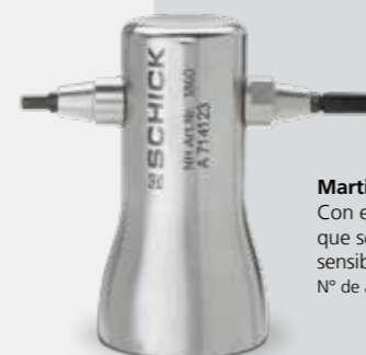
Martillo doble Con el casquillo plástico que se utilizan superficies sensibles Nº de art. 1860*