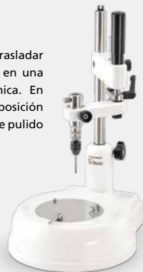
Paralelómetro S1 Basic

El paralelómetro de S1 Basic para medir, trasladar y bloquear se puede equipar y convertir en una fresadora de manera sencilla y económica. En caso de necesidad, tiene también a su disposición componentes individuales para las tareas de pulido en húmedo.